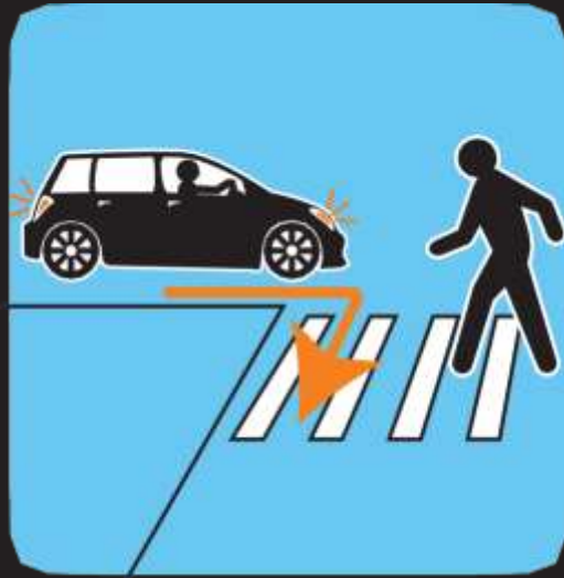
انتبه للسيارات المنعطفة