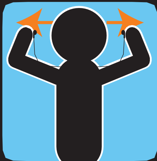
انزع سماعات الأذن وانتبه