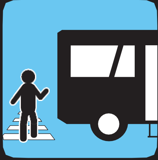
سير بأمان عند النزول من الحافلة