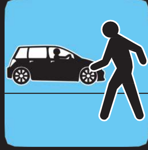
امش في مواجهة حركة المرور