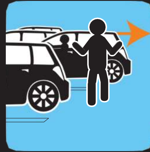
توخ الحذر في مواقف السيارات