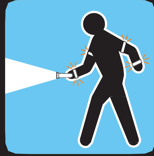
تمييز في ظلام الليل