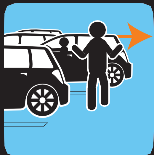
Tenga cuidado en los estacionamientos