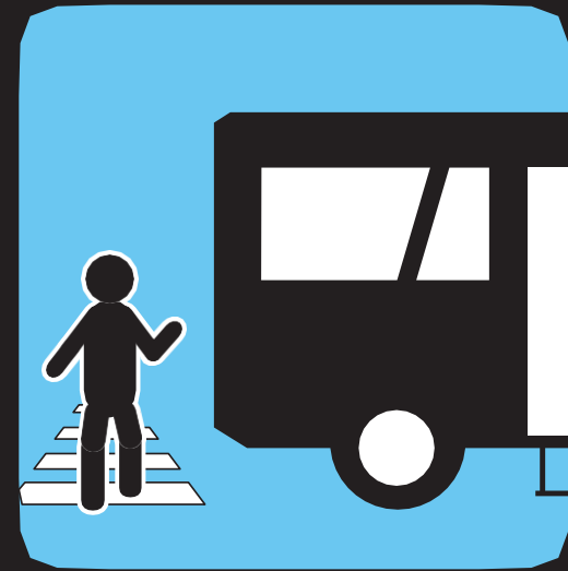
Cruce de forma segura al bajar del autobús