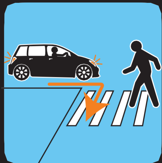
Esté atento al movimiento de los automóviles