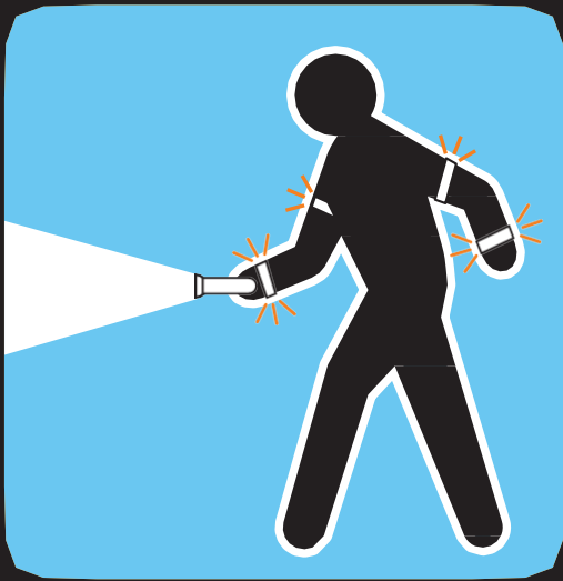
Brille en la noche