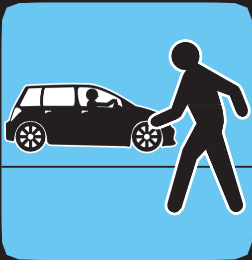
Circule en sentido contrario al tráfico vehicular